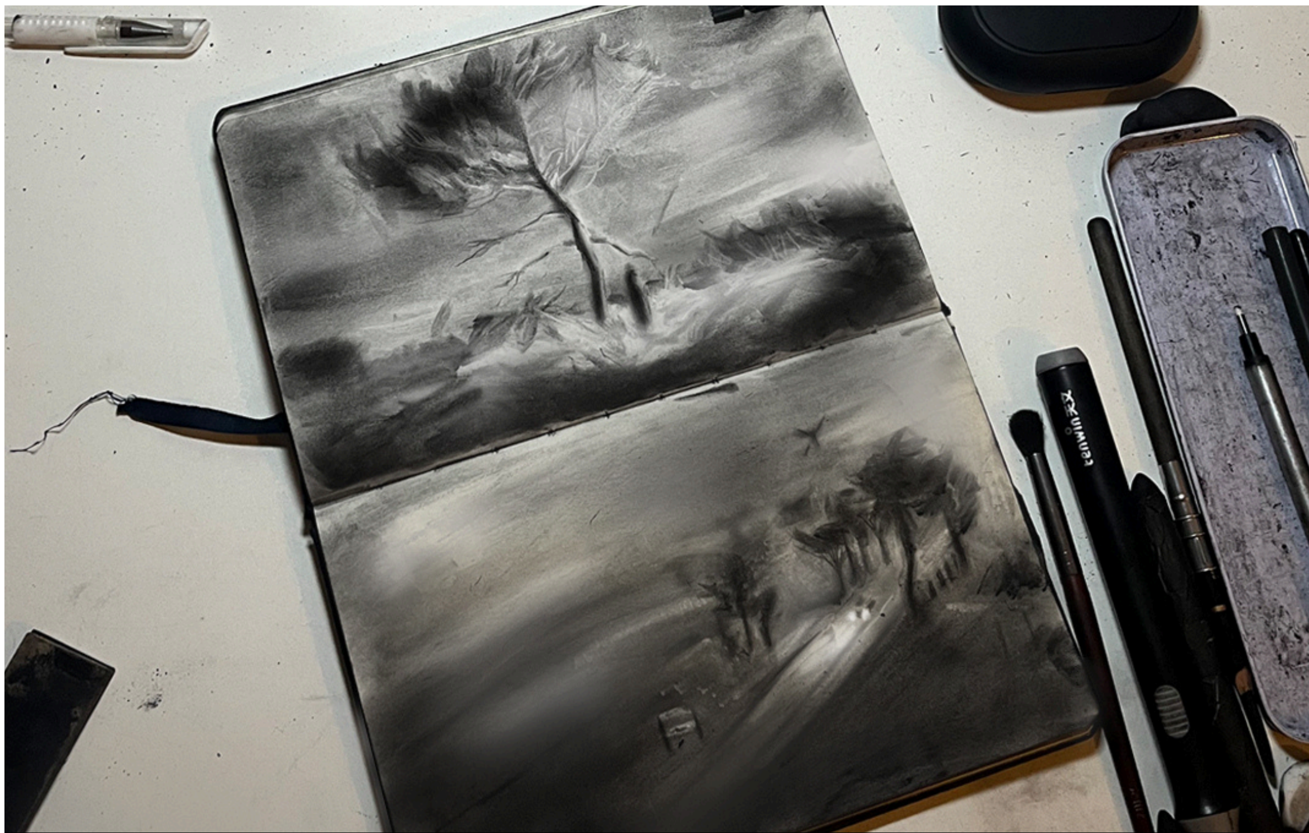
Passagens 2025 Carvão 30 x 21 cm