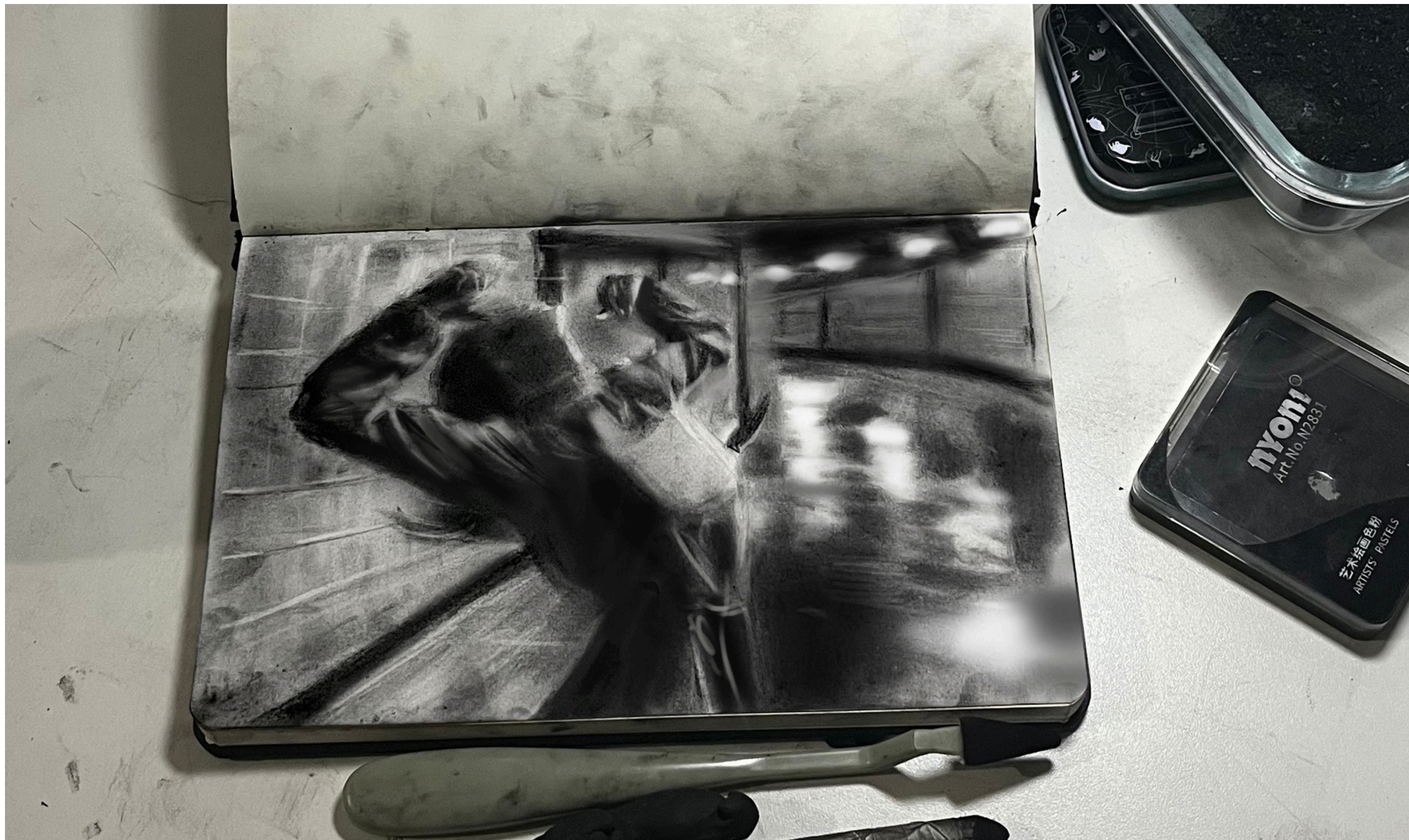
Possessão 2025 Carvão 14,8 x 21 cm