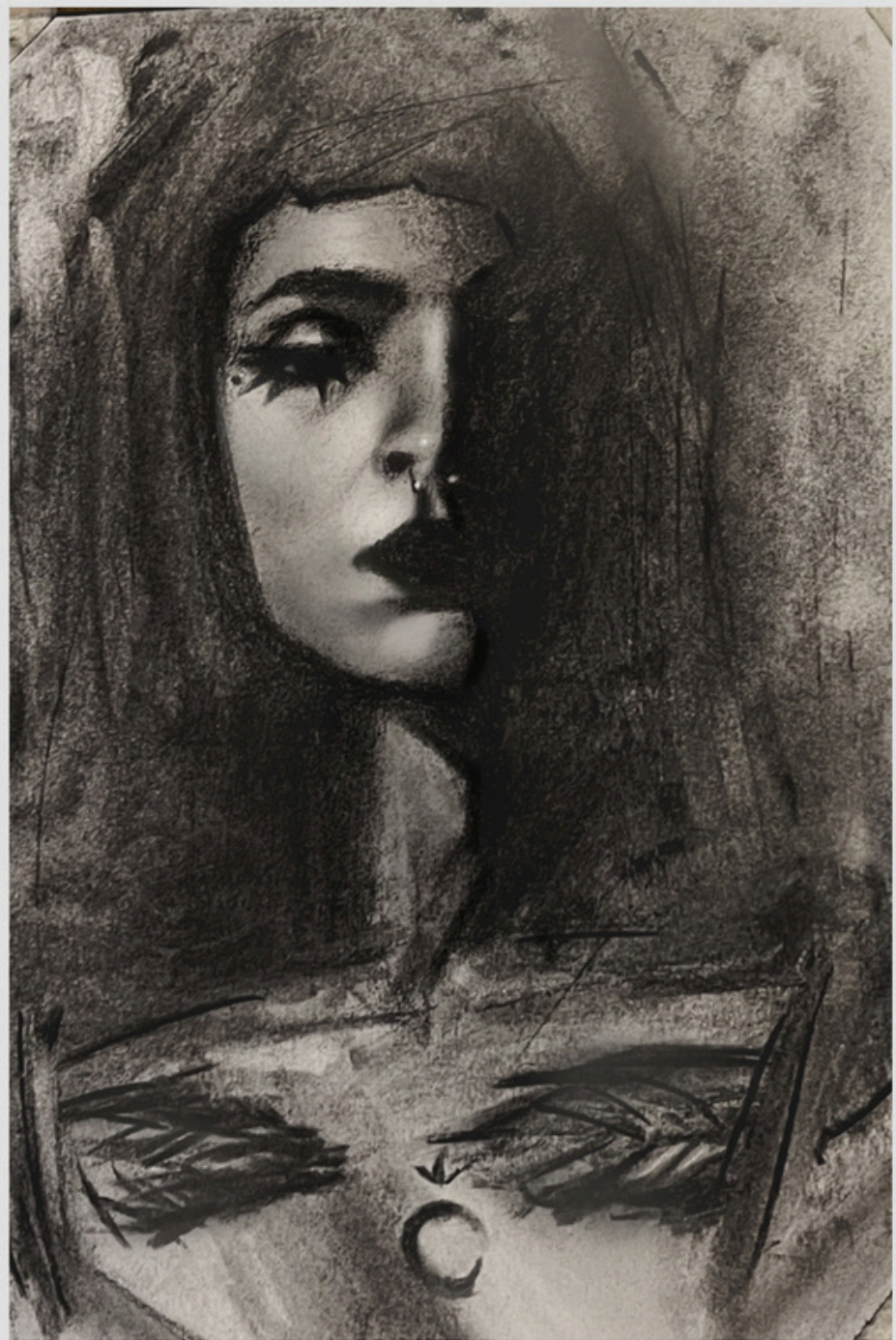
Lara 2025 Carvão 21 x 29,7 cm