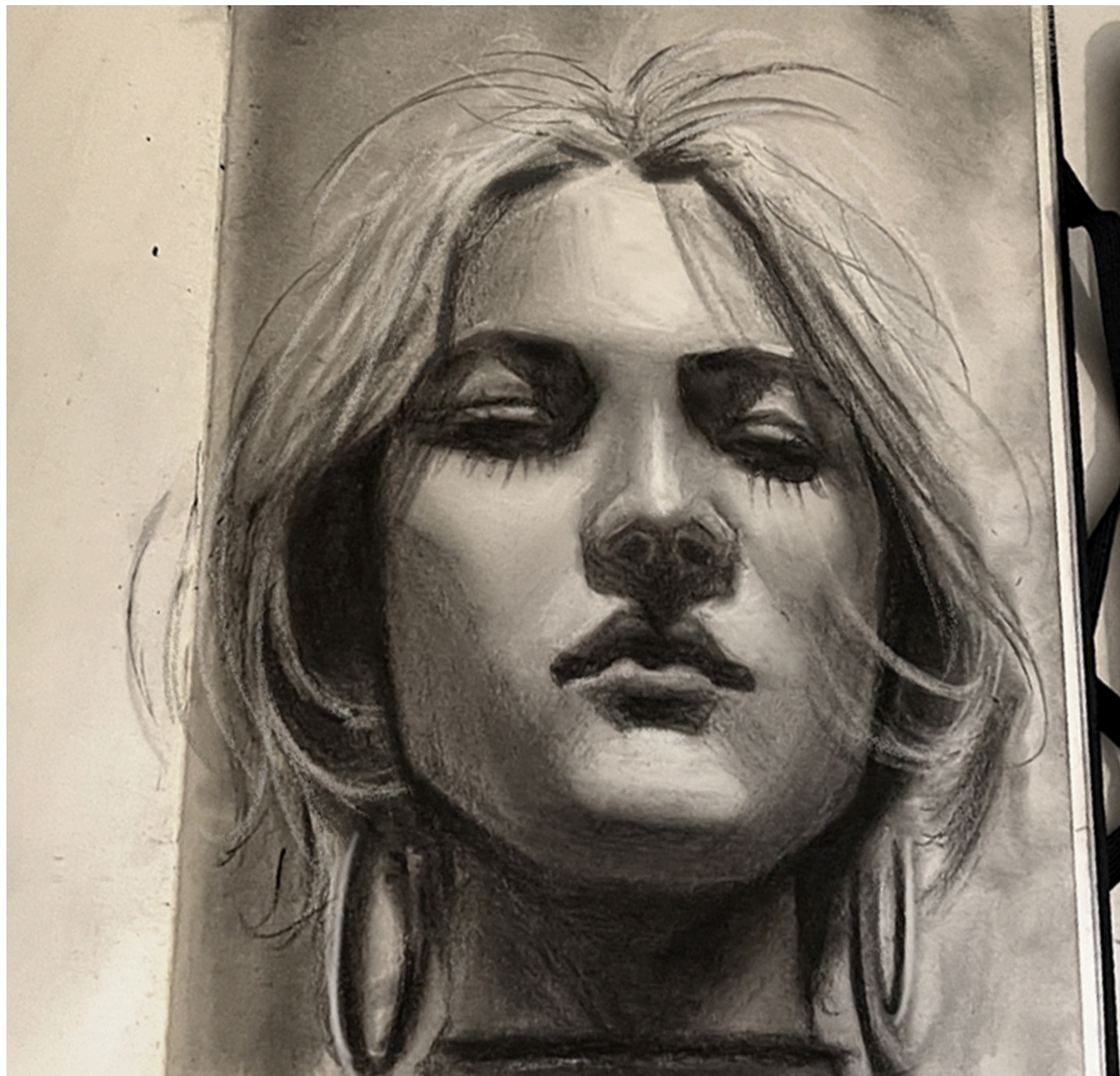
Não olhe 2025 Carvão 21 x 14,8 cm